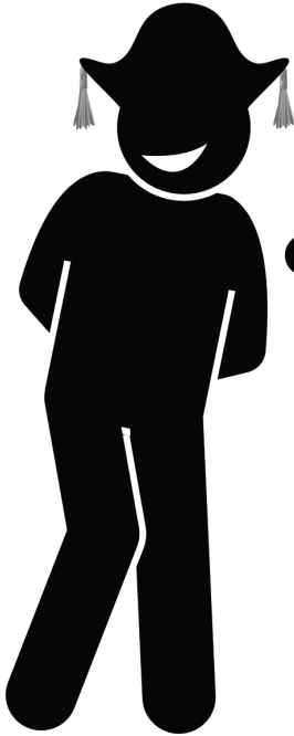
Książę Piegon Facon